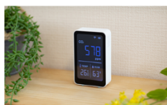
+Style センサー (CO2・温湿度)